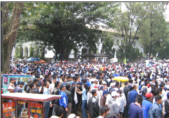
Foto diambil dari lapangan Gasibu mengarah ke salah satu sudut bangunan sayap Kompleks Gedung Sate.