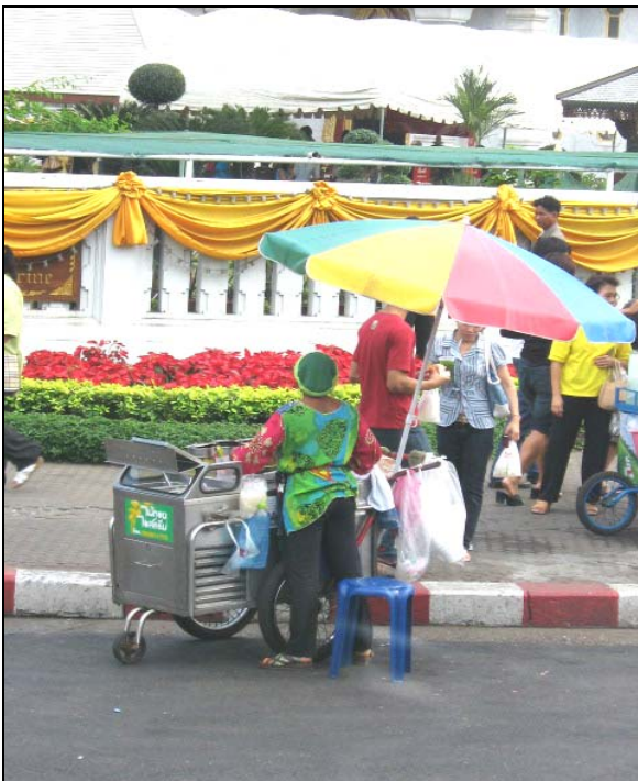
Gambar 16. Salah satu contoh gerobak/perangkat jual hasil rancangan desainer guna mendukung kegiatan para pelaku sektor informal. Perangkat dan alat yang bersih dan terancang baik akan meningkatkan kualitas kinerja secara keseluruhan dan akan meningkatkan pendapatannya