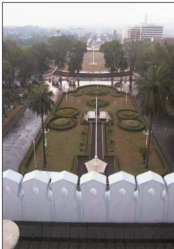
Gambar 5. Formalitas Kompleks Gedung Sate– Lapangan Gasibu – MPRJB (Foto dari lantai tertinggi Gedung Sate, mengarah ke halaman kompleks Gedung Sate dan Lapangan Gasibu. Tampak Gedung

Keberadaan Kompleks Gedung Sate– Lapangan Gasibu hingga tahun 1980an telah menjadi salah satu tengaran di kota Bandung. Pada tahun 1985 dibangunlah Boulevard MPRJB yang terletak di sebelah utara lapangan Gasibu, memanjang pada sumbu imajiner yang menghubungkan Gedung Sate dan Tangkubanparahu. Salah satu latar belakang dibangunnya monumen ini adalah untuk melanjutkan rencana yang telah digagas sebelumnya yaitu membangun kompleks ini menjadi ruang kota dengan karakter formal untuk mendukung fungsi kompleks Gedung Sate sebagai fasilitas perkantoran pemerintah yang bersifat formal. Hingga tahun 1995an ketika diselenggarakan peresmian Monumen, lapangan Gasibu belum menunjukkan keberagaman aktivitas seperti sekarang ini. Kegiatan yang umumnya dilakukan di lokasi ini adalah olah raga dan kegiatan komunal lain seperti upacara-upacara hari besar nasional, pameran-pameran terbuka yang diselenggarakan oleh pemerintah tidak lebih dari 4 kali dalam setahun, dan kegiatan keagamaan yang juga diselenggarakan oleh pemerintah seperti sholat hari Raya Idul Fitri, dan lain-lain