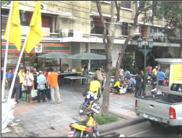
Gambar 15. Suasana salah satu trotoar di sekitar area pusat kota Bangkok. Lebar trotoar yang sangat memadai, memungkinkan berbagai aktivitas sosial terjadi dan "menghidupkan" kota.

area yang diijinkan dan (sebagian kecil area) yang terlarang, termasuk pengaturan waktu (saat-saat boleh berjalan). Harmoni informalitas dan formalitas menjadi tujuan akhir yang perlu terus diupayakan. Dengan memberikan "ruang gerak" yang memadai bagi keberadaan informalitas, maka keduanya akan mencari bentuknya masing-masing dalam sebuah hubungan yang diharapkan pada gilirannya akan mencapai sebuah bentuk kesetimbangan baru.