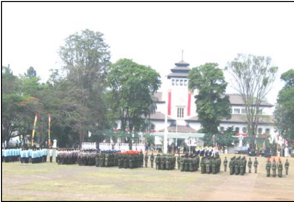
Gambar 10. Suasana ketika lapangan digunakan sebagai tempat upacara

Bandung Lautan Api (Maret), Hari Pendidikan Nasional (Mei), Hari Kebangkitan Nasional (Mei), peringatan hari kemerdekaan (Agustus), Hari Jadi Kota Bandung (September), Kesaktian Pancasila (Oktober), dan lain-lain. Ketika "penguasa formal" memerlukan area ini, secara alamiah para aktor yang sehari-hari menghidupkan ruang ini akan "menyingkir" untuk sementara ke kantong-kantong area di sekitar lapangan, seperti sudut-sudut persimpangan, halaman kantor-kantor, dan lain-lain.